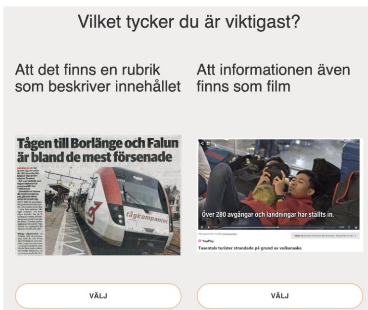
Figur 1: Exempel på hur påståenden presenteras i testverktyget.

Enkelt uttryckt kan detta beskrivas som att påståenden "går matcher" mot varandra. En algoritm för att rangordna schackspelare används för att rangordna påståenden. Ju fler vinster och särskilt mot påståenden som också får många vinster, desto viktigare är påståendet.